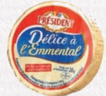
Président - Délice de fromages Gamme de fromages fondus, goût camembert, emmental, chèvre, avec une texture onctueuse, riche en calcium DR