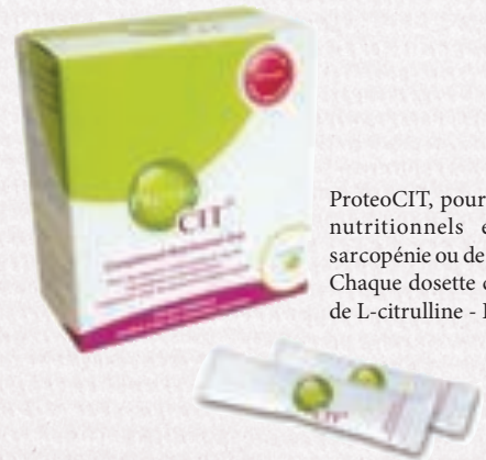
ProteoCIT, pour les besoins nutritionnels en cas de sarcopénie ou de dénutrition. Chaque dosette contient 5 g de L-citrulline

Rédaction : Béatrice de Reynal • Conception graphique : Douchane Momcilovic • Mise en page : Alix de Reynal