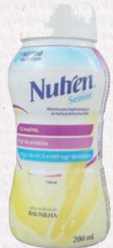
Nutren Senior - Nestlé Boisson riche en calcium, vitamine D et protéines pour patients dénutris.