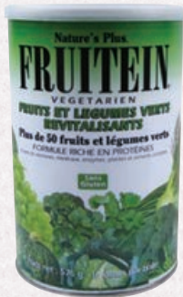
Nature's Plus Formule riche en protéines Pharmacie - France