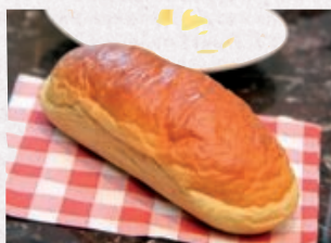
Cérélab - GNutrition®

Il est important de proposer aux patients dénutris, une alimentation soignée et appétente. En effet, les sens émoussés, la baisse de moral due à l'isolement et l'éloignement de son milieu personnel, entraîne une dépression morale et une perte d'appétit. Ajoutons que les patients touchés par Alzheimer perdent parfois l'usage des couverts et ont alors besoin de mets faciles à porter en bouche, simplement du bout des doigts.