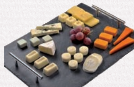
Avenance - Bouchées Saveur adaptées aux patients atteints par la maladie d'Alzheimer

Avenance Santé-Résidences propose la gamme "Faciles à Manger®", constituée de repas enrichis et qualitatifs élaborés par un comité d'experts pluridisciplinaires (médecin nutritionniste, diététicienne, chef) pour répondre aux problèmes de dénutrition chez les grands Seniors :